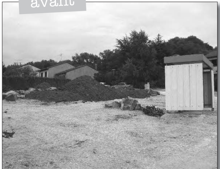
Travaux d'aménagement de la place du Fort.