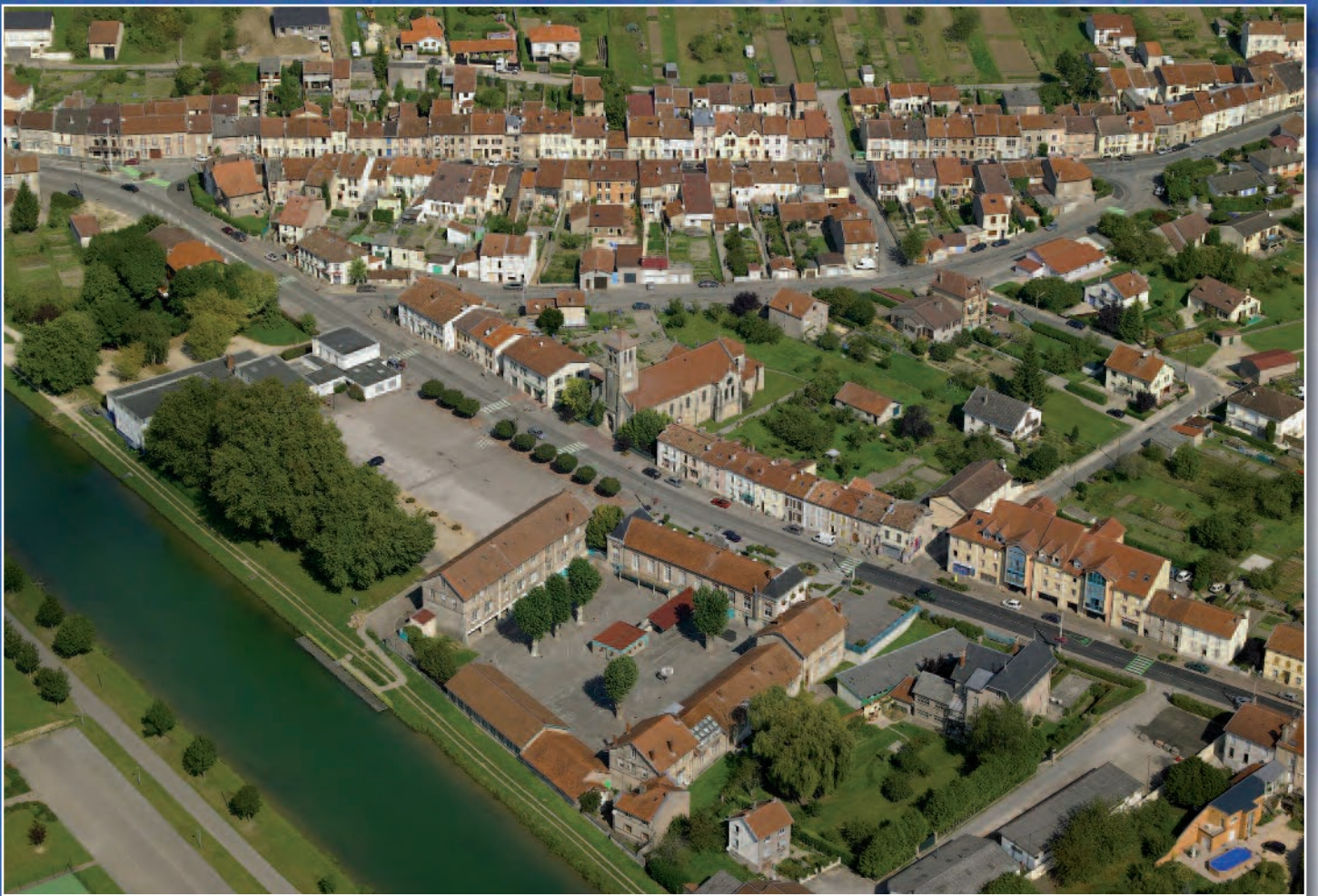
La commune de Belleville-sur-Meuse vue du ciel