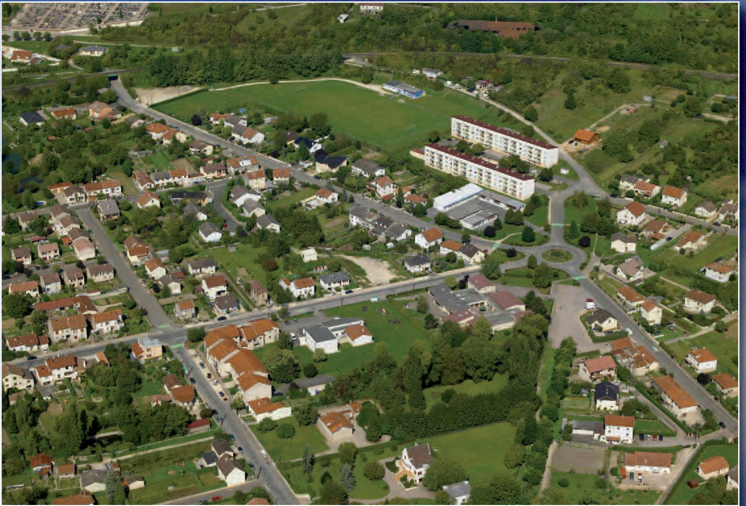
e-sur-Meuse vue du ciel