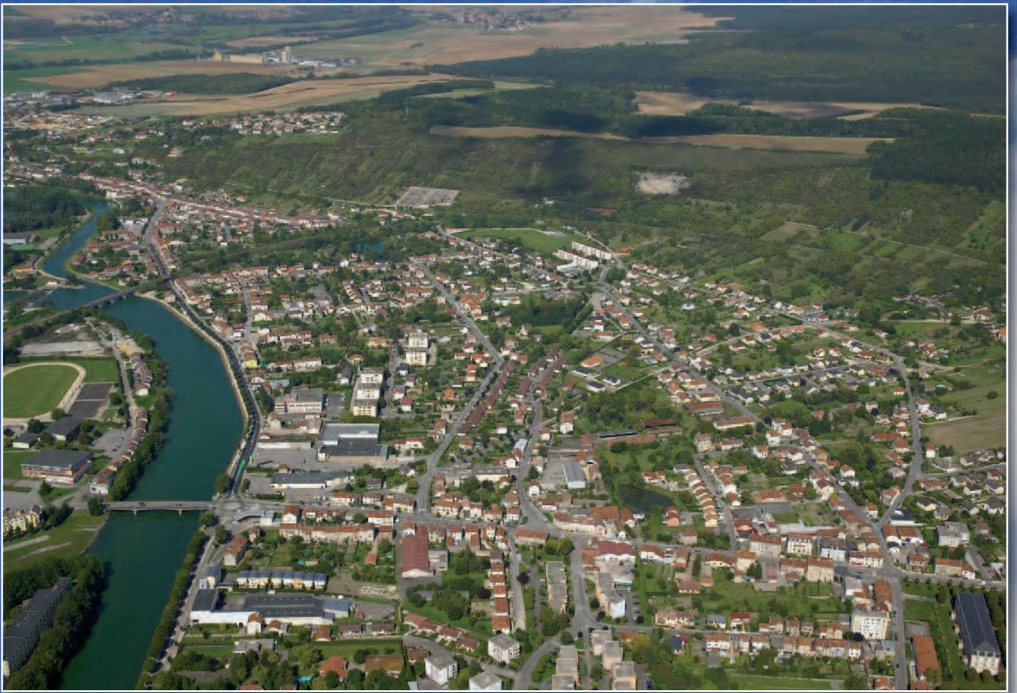
La commune de Belleville