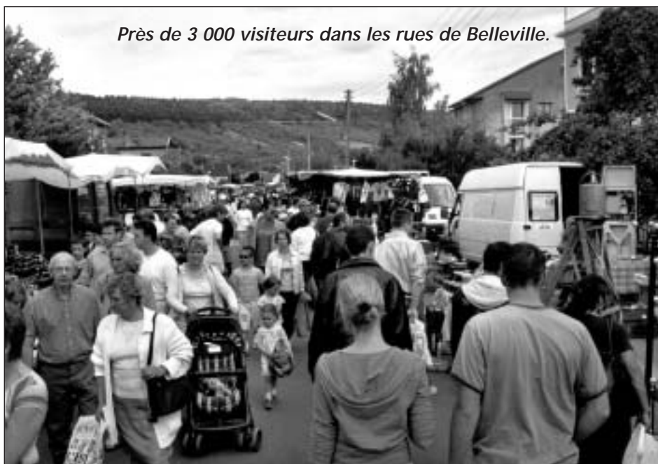
Près de 3 000 visiteurs dans les rues de Belleville.