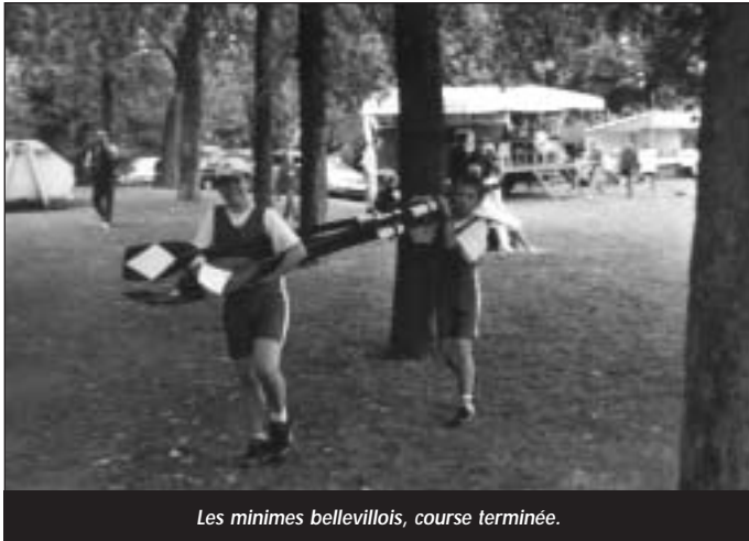
Les minimes bellevillois, course terminée.