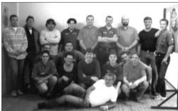
« Les joueurs de la Coupe du Comité au grand complet ».