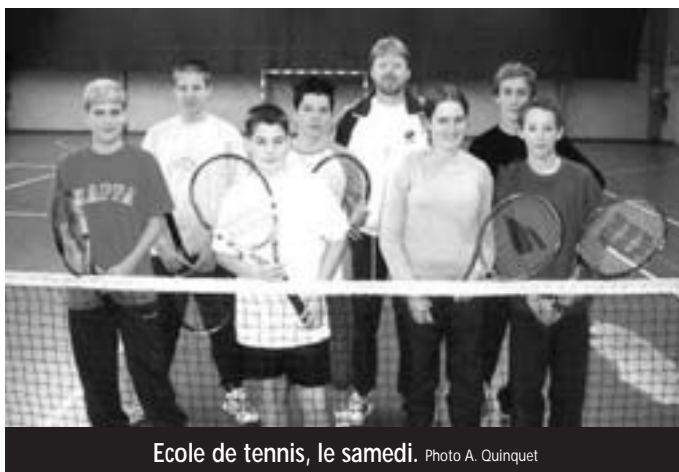
Ecole de tennis, le samedi.

Nous avons désormais 10 jeunes débutants à l'entraînement du mercredi soir, de 18h à 19h15, encadrés par Pierrette, Jean-Claude et Barbara. 7 jeunes en perfectionnement le samedi de 9h30 à 11h30, entraînés par Alain.