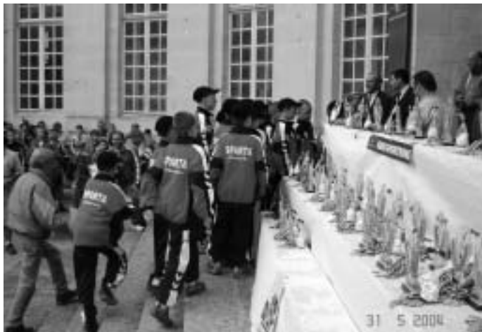
La remise des trophées au CENTRE MONDIAL DE LA PAIX en 2004. Continuons à vivre des émotions.

Si nous voulons rester la référence en Meuse et en Lorraine en matière d'organisation d'une manifestation internationale, nous devons tout faire pour