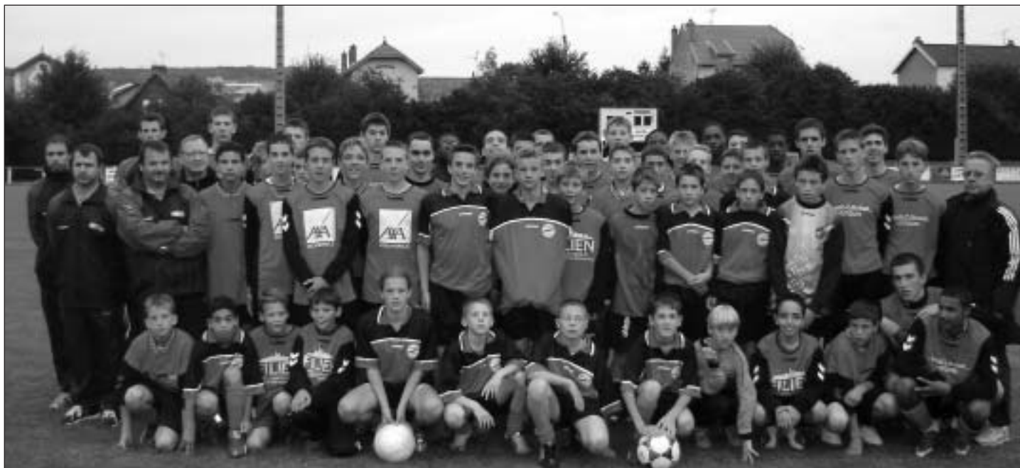
Des jeunes qui préparent la relève dans les meilleurs championnats de la région (13-15-18 ans).