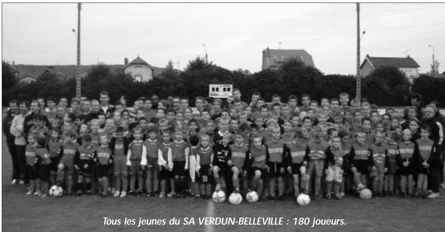
Tous les jeunes du SA VERDUN-BELLEVILLE : 180 joueurs.