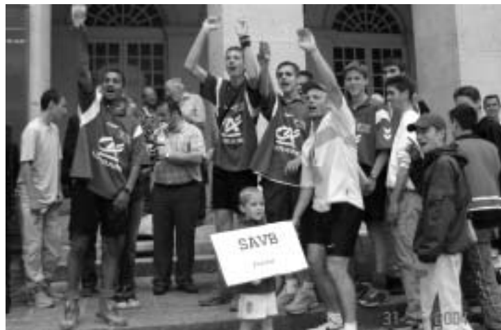
VERDUN-BELLEVILLE vainqueur en catégorie B.

mettre en place la onzième édition. Si l'envie est plus forte que tout, le message de PAIX et de SPORT continuera de passer... dans le cas contraire, le TROPHEE DE LA PAIX aura vécu.