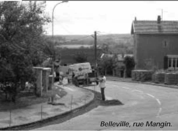
Belleville, rue Mangin.

Cette liste récapitulative retrace les principales actions, mais il faut noter et souligner le travail effectué par les agents des services techniques au quotidien. A savoir tout l'entretien des espaces verts de la commune, le fleurissement, l'entretien régulier dans les bâtiments communaux (écoles, halle des sports, bâtiments des associations), l'entretien de la voirie communale et des chemins, la vérification régulière de l'éclairage public, les interventions sur le réseau d'eau apportée aux associations lors de l'organisation de leurs manifestations. A noter, le temps important à passer pour installer les illuminations de Noël ; Chaque année, la commune essaie d'ajouter des décorations dans de nouvelles rues ou nouveaux quartiers, ce qui augmente forcément le travail d'installation.