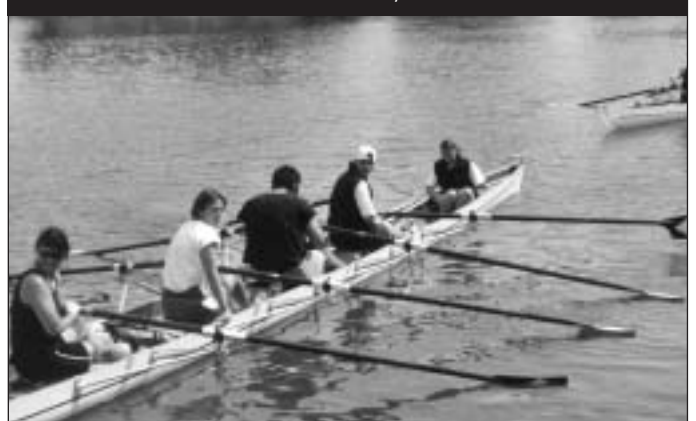
Arrivée de la randonnée des 3 frontières, au bout de 60 km d'efforts...