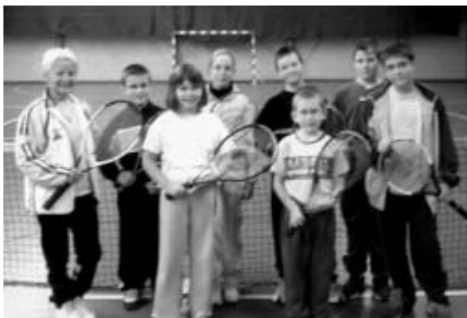
Ecole de tennis, le mercredi.

Depuis le 15 septembre 2004, notre école de tennis a réouvert ses portes, et les jeunes loin de nous bouder, après une année d'interruption, y ont repris leur place naturellement. Le succès dépasse nos espérances.